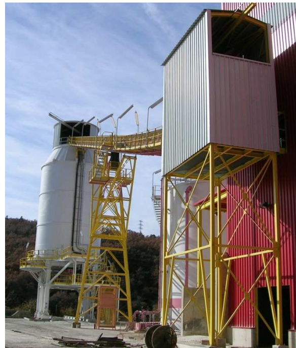
Transporte y almacenamiento de yeso de desulfuración

Siguiendo el recorrido del yeso, el conjunto se compone de: Dos tolvinos by-pass que recogen el yeso procedente de los filtros de banda y lo direccionan bien a la cinta transportadora de emergencia que vierte a camión si las condiciones del yeso no son adecuadas, o bien a la cinta transportadora que carga el silo. El silo posee un sistema extractor compuesto por una estructura deslizante que mediante