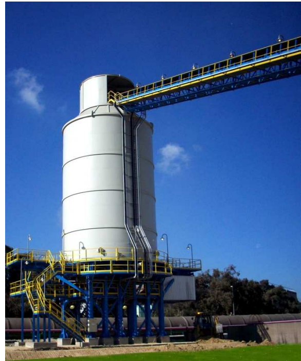
Transporte y almacenamiento de yeso de desulfuración

Siguiendo el recorrido del yeso, el conjunto se compone de: Dos tolvinas by-pass que recogen el yeso procedente de los filtros de banda y lo direccionan bien a la cinta transportadora de emergencia que vierte a camión si las condiciones del yeso no son adecuadas, o bien a la cinta transportadora que carga el silo. El silo posee un sistema extractor compuesto por