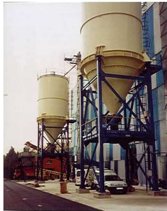
Recepción, transporte y almacenamiento de fangos Secado Térmico E.R.A.R. SUR

En la salida de los secadores TAM ha instalado dos sinfines (uno para cada línea de secado) que transportan el fango ya seco hasta los elevadores de cangilones que cargan los silos.